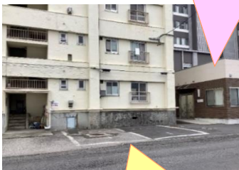
ひまわりハウス 専用駐車場（3台）