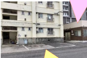
ひまわりハウス専用駐車場（3台）