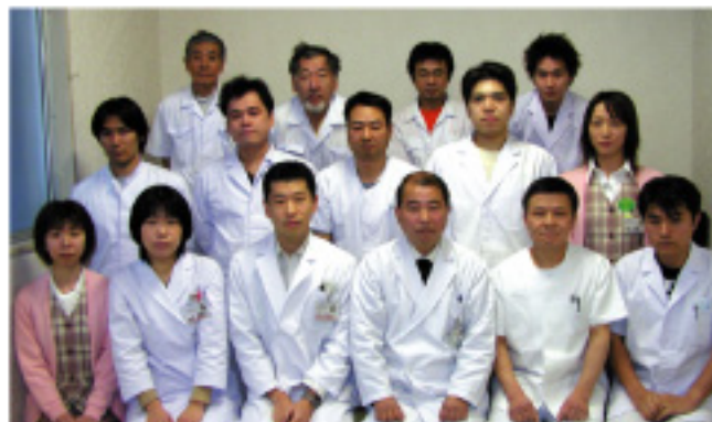
栄養管理室スタッフ