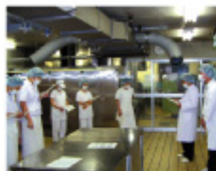
食品衛生講習会 (年4回外部の講師を招く)