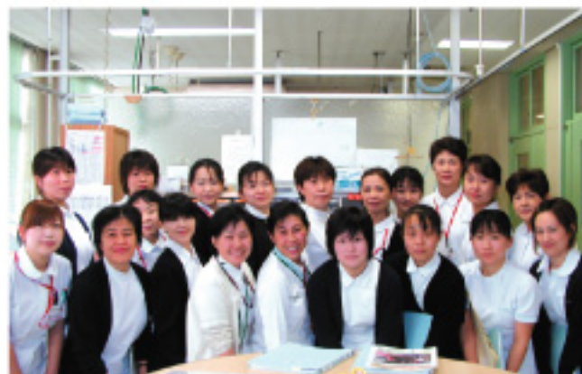
外来看護師スタッフ

また、昨年7月からは、病棟との継続看護を維持できるよう、病棟スタッフが外来看護に参画しています。患者様からは、入院中に身も心も預けた顔見知りの方がいてくれて良かった、聞き漏ら